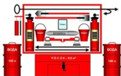
Рис. 4. Пожарный щит

На щитах размещается следующий ручной пожарный инвентарь: ломы, багры, топоры, ведра. Рядом со стендом устанавливается ящик с песком и лопатами, а также бочка с водой емкостью 200-250 литров.