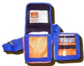
Рис. 3. Комплект индивидуальный медицинский гражданской защиты

КИМГЗ (рис 3) укомплектован в соответствии приказом МЧС России от 23.01.2014 № 23 и с приказом Минздрава России от 15.02.2013 № 70н «Об утверждении требований к комплектации лекарственными препаратами и медицинскими изделиями Комплекта индивидуального медицинского гражданской защиты (КИМГЗ) для оказания первичной медико-санитарной помощи и первой помощи».