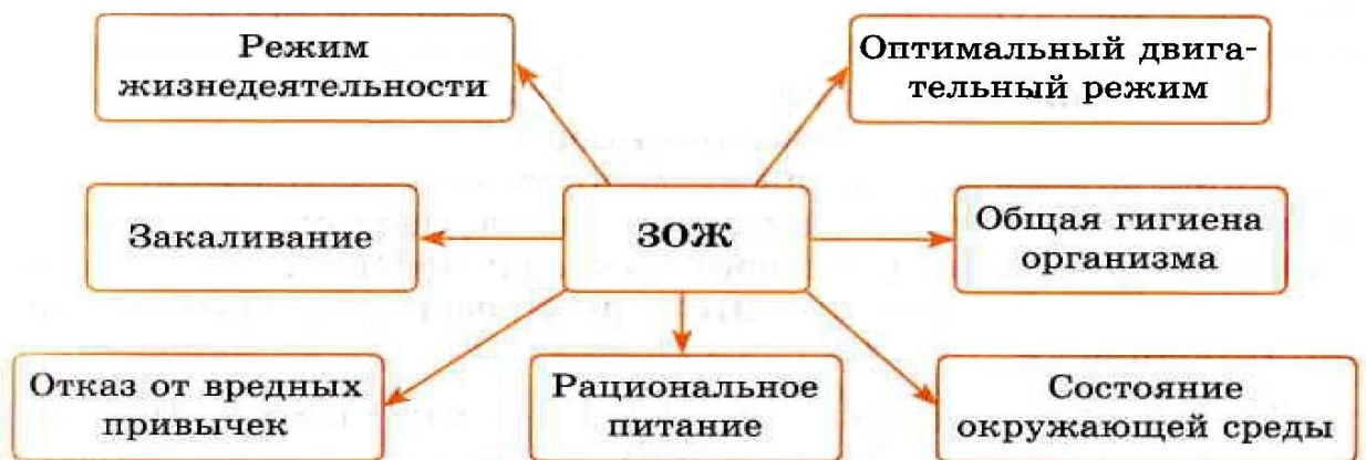
С х е м а 1. Основные составляющие здорового образа жизни