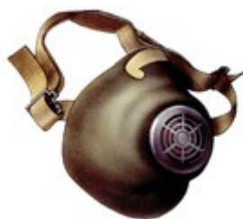
Рис. 2. Респиратор Р-2

Наружная оболочка полумаски изготовлена из пенополиуретана (пористого синтетического материала), а внутренняя из тонкой воздухонепроницаемой пленки, в которую вмонтированы клапаны вдоха. Между наружной и внутренней оболочками расположен фильтр из полимерных волокон.