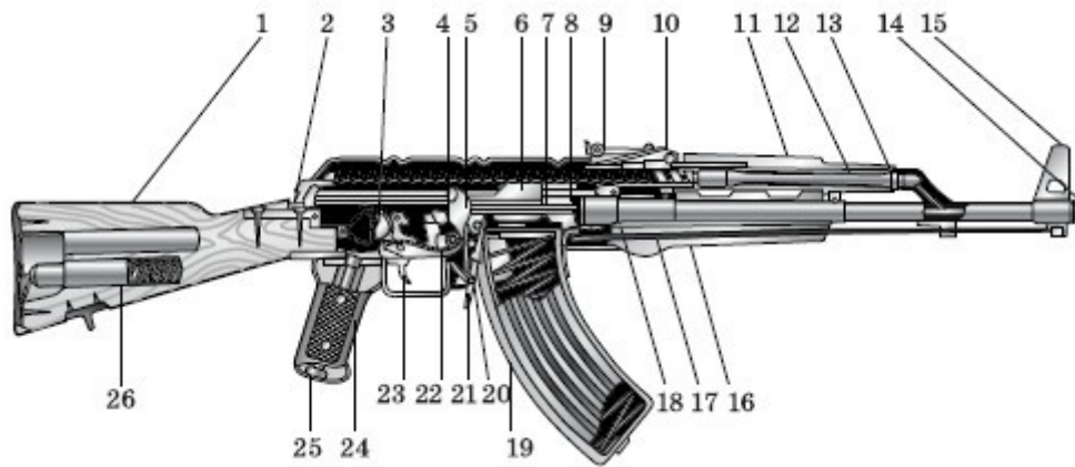
Рис. 10. Устройство автомата: 1 – приклад; 2 – выступ направляющего стержня возвратного механизма; 3 – переводчик; 4 – крышка ствольной коробки; 5 – курок; 6 – затворная рама; 7 – ударник; 8 – затвор; 9 – прицельная планка; 10 – колодка прицела; 11 – ствольная накладка; 12 – газовый поршень; 13 – газовая трубка; 14 – муфта ствола; 15 – основание мушки; 16 – цевье; 17 – шомпол; 18 – ствол; 19 – магазин; 20 – защелка магазина; 21 – боевая пружина; 22 – рычаг автопуска; 23 – спусковой крючок; 24 – пистолетная рукоятка; 25 – соединительный винт; 26 – принадлежность

№ 8 Уход за оружием, его хранение и сбережение.