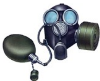
Рис.1. Гражданский фильтрующий противогаз ГП-7В

Противогаз ГП-7В (рис 1) комплектуется лицевой частью трех ростов для любых размеров лица человека. Маска позволяет вести переговоры как при непосредственном общении, так и при работе с техническими средствами связи.